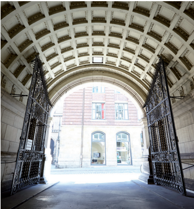
Torbogen Haupttreppe Flur mit Paternoster und Aufzug